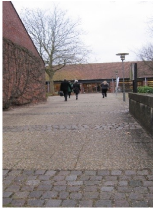
Adgangsvej fra p-pladsen til rådhusets hovedindgang

Hovedindgangen består af et glasparti med en skydedør i midten. Indenfor – i vindfanget – fører en skydedør af glas ind i Borgerservice.