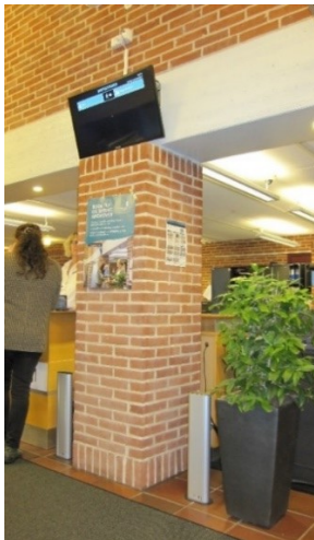
Skærm i venteområdet

I borgerservicelokalet er der i venteområdet en skærm, der med skrift kalder den ventende frem. Der er tale om en meget lille skrift, som svagtseende vil have svært ved at se. Der er ingen lyd, som kan kompensere for den lille skrift.