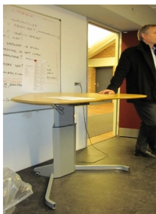
Hæve-sænke-bordet i det særlige brevstemmelokale

Afstemningspladsen i kontoret bestod af et hæve-sænke-bord. Jeg henviser i den forbindelse til, at det af § 4, stk. 2, i bekendtgørelse om hjælpemidler, der skal stilles til rådighed ved stemmeafgivningen, fremgår, at et hæve-sænke-bord (minimum 90 x 60 cm og med fri benplads) skal stilles til rådighed på mindst ét af de steder i kommunen, hvor en vælger kan afgive sin brevstemme.