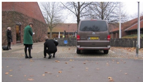
Handicapparkeringspladserne foran rådhuset i Ringe

Belægningen på indkørslen til p-pladsen er asfalt. Selve handicapparkeringspladserne er belagt med fliser og flade brosten. Samme slags fliser og flade brosten udgør desuden adgangsvejen fra p-pladsen til hovedindgangen.