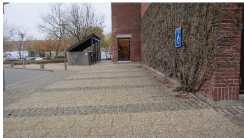
Handicapparkeringspladsen langs muren af rådhuset

Den tredje p-plads er placeret langs muren til rådhuset. Pladsen er ikke markeret, og den var derfor ikke mulig at opmåle.