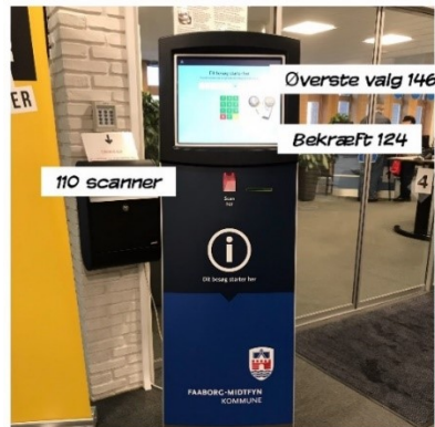
Velkomststander i Borgerservice

Højden på standeren blev målt til 1,46 m (op til øverste knap, som var knap-pen til angivelse af, at man ønskede at afgive en brevstemme).