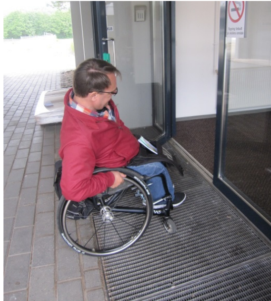
Indgang til blok 1.

Om Rosborg Gymnasiums parkeringsforhold anbefalede besøgsholdet under inspektionen, at der blev opsat skiltning til handicapparkeringspladserne, således at det er muligt at orientere sig om handicapparkeringspladsernes placering, når man ankommer til Rosborg Gymnasium. Besøgsholdet gjorde i denne forbindelse opmærksom på, at den midlertidigt anlagte handicapparkeringsplads kun var til at finde, hvis man på forhånd var bekendt med dens placering.