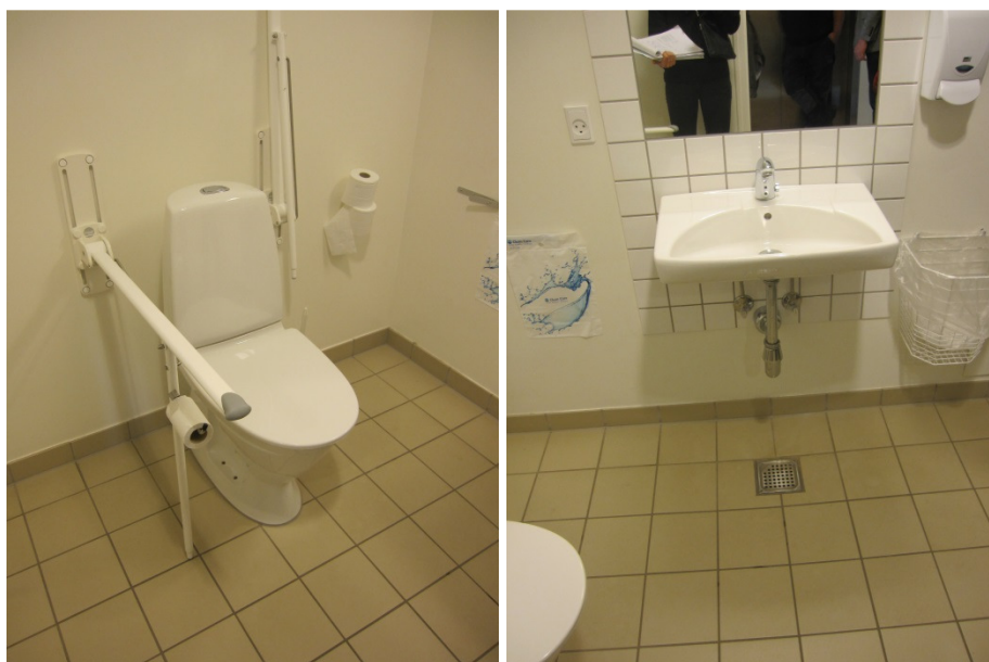
Handicaptollet ved kantine og auditorium.

Toilettet i stueplan ved kantine og auditorium var nyetableret og rummeligt. Der var niveaufri adgang dertil. Højden på toilettet var 46 cm. Der var opsat opklappelige armstøtter, der var opsat i en højde af 76 cm. Armstøtterne var 86 cm lange. Ved siden af toilettet (modsat vasken) var der 91 cm fri afstand. Afstanden fra toiletet til armatur på vasken var 55 cm. Vasken var 85 cm dyb og opsat i en højde af 86 cm. Spejlet over vasken sad 1,01 m fra gulv. Dispenser med papir til at tørre hænder efter håndvask var opsat i en højde af 1,32 m. Sæbedispenseren sad 1,10 m fra gulv.