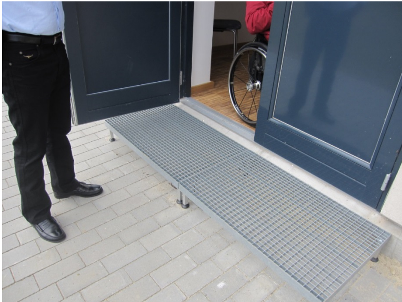
Nødudgang ved auditoriet.

Besøgsholdet anbefalede, at Rosborg Gymnasium finder en måde, hvorpå denne adgangsør gøres mere tilgængelig, eksempelvis ved en rampe, således at alle elever – også elever i kørestol – har mulighed for at trække frisk luft i pauserne og derved være en del af det sociale samvær.