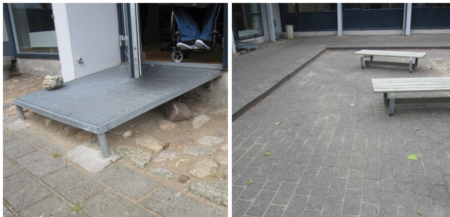
Niveauforskel ved udgang til gårdareal og gård.

Besøgsholdet anbefalede desuden, at gymnasiet, når gårdarealerne en gang skal renoveres, udligner niveauforskellen, således at hele gården er tilgængelig.