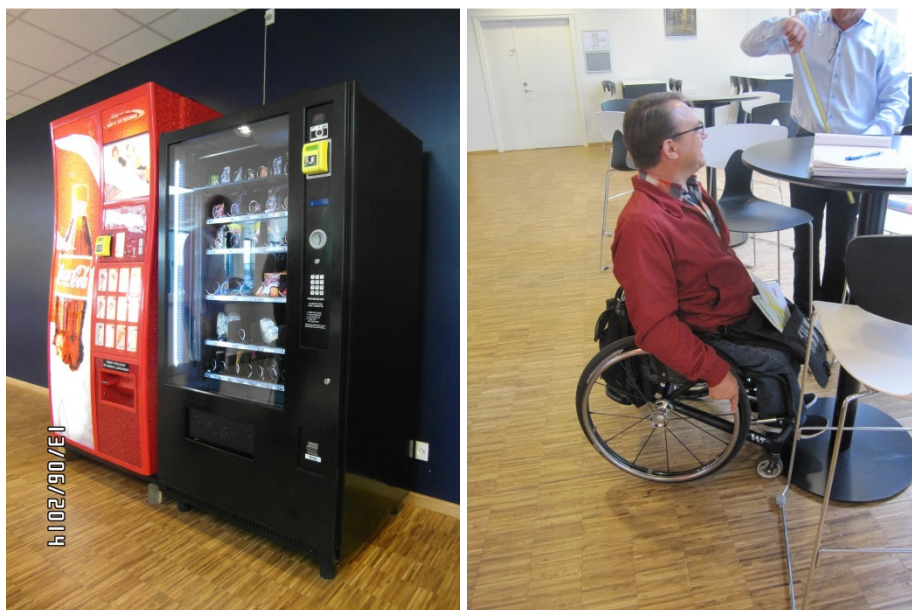
Automater og høje caféborde i kantinen.

Besøgsholdet henviste til SBI's tjekliste for handicaptilgængelig indretning af brugerbetjente anlæg og udgivelsen "Handicaptilgængelig udformning af brugerbetjente anlæg" (udført af Dansk Center for Tilgængelighed for Erhvervs- og Byggestyrelsen og IT- og Telestyrelsen, opdateret af Statens Byggeforskningsinstitut december 2007) til inspiration.