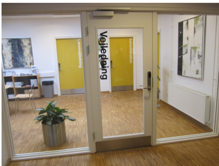
Indgangsparti af glas.

Jeg har noteret mig det oplyste og foretager mig ikke mere i den anledning.