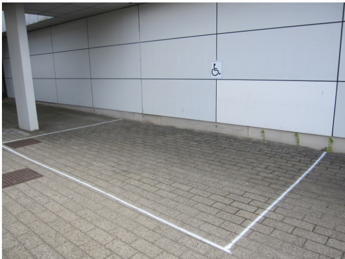
Midlertidig handicapparkeringsplads, blok 1.

Den midlertidigt anlagte handicapparkeringsplads var placeret langs muren ved blok 1. Handicapparkeringspladsen målte 3,5 x 5 m. Der var opsat et handicappiktogram på væggen ved pladsen. Der var ikke malet et piktogram på belægningen, der var af fliser.