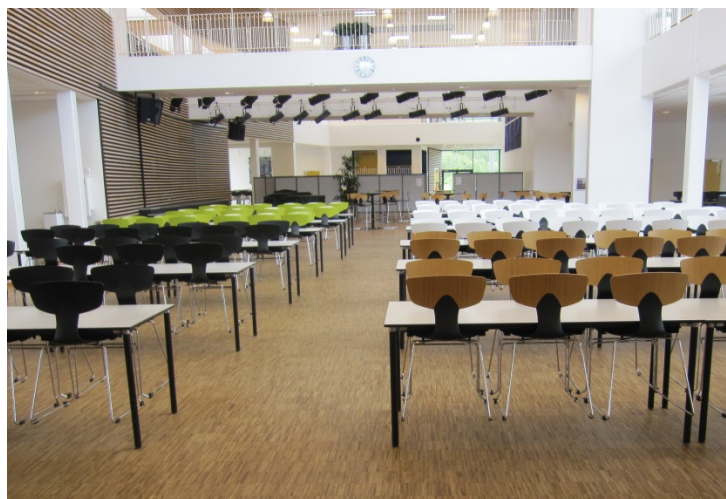
Spisepladser i kantinen.

Lokalet var rummeligt, og der var plads til at manøvrere rundt. Det var muligt at fjerne en stol ved bordet for derved at gøre plads til en kørestolsbruger.