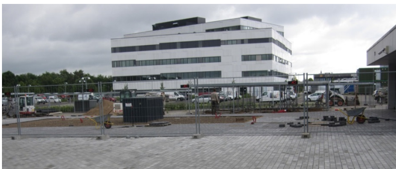
Etablering af handicapparkeringspladser ved hovedindgangen.

Ledelsen oplyste, at det desuden var muligt at køre helt op til indgangen i forbindelse med af- og påstigning.