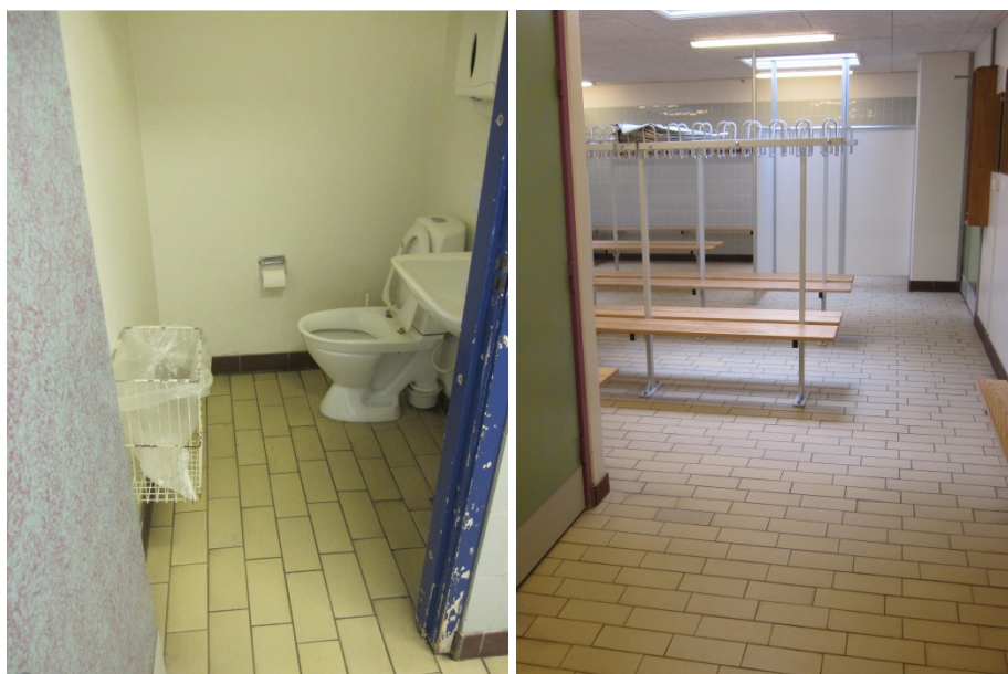
Toilet og omklædning.