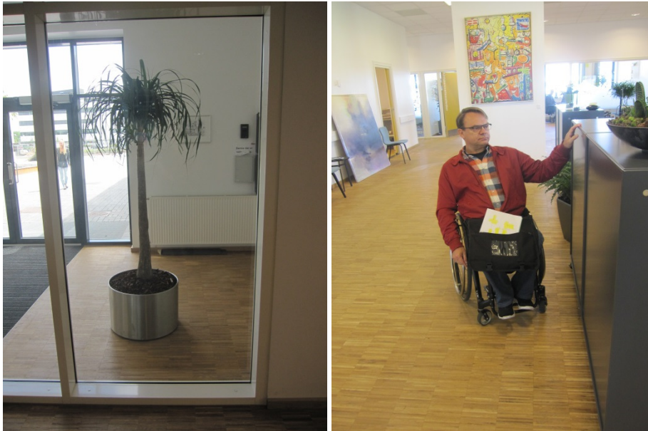
Glasparti ved hovedindgang og skranke i administrationen.

I den foreløbige rapport bad jeg om, hvad der er sket i anledning af de to anbefalinger.