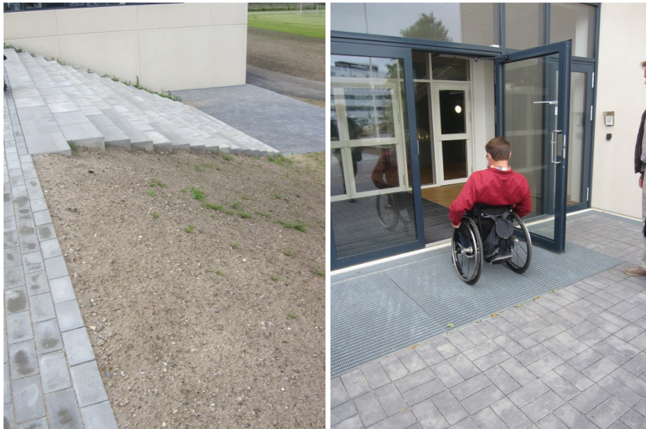
Trappe og hovedindgang.

Foran indgangsdøren var anlagt riste. Der var umiddelbart niveaufri adgang til bygningen, dog således at der ved indgangen var en kant på i alt 3 cm (en kant på 1 cm efterfulgt af endnu en kant på 2 cm). Indgangsdørene var af glas, og der var ingen markeringer på dørene.