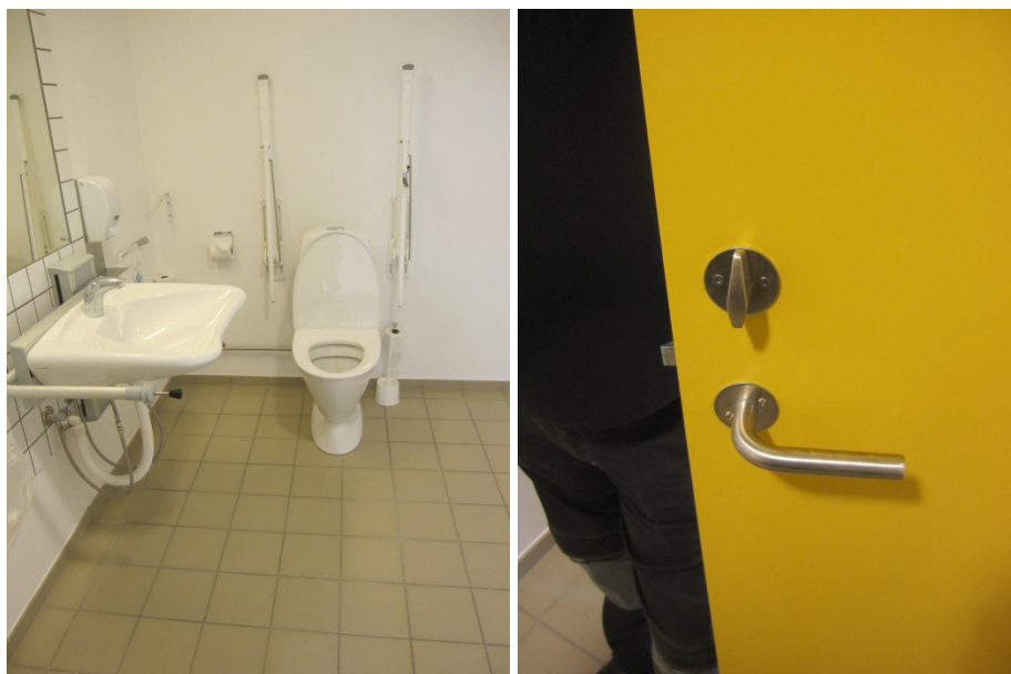
Handicaptoliet ved "dagligstuen".

Toilettet ved "dagligstuen" fremstod meget rummeligt og ligeledes nyetableret. Der var en hæve-sænke-vask på toilettet, således at vasken kunne justeres efter højde. Toilettet var 46 cm højt og havde armstøtter. Det var muligt at betjene vasken fra toilettet. På døren ind til toilettet var opsat en lås med en ekstra stor vrider, hvilket gør det nemmere for personer med nedsat kraft i fingre og arme at betjene låsen.