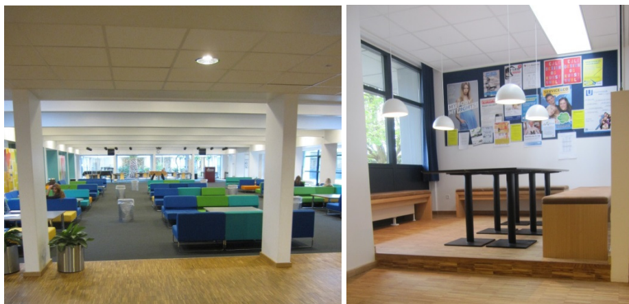
"Dagligstue" og åbne grupperum.

Besøgsholdet bemærkede, at niveauforskellen og indretningen af de åbne grupperum afskar kørestolsbrugere fra at benytte rummet, men at det på baggrund af det ovenfor anførte ikke gav anledning til yderligere.