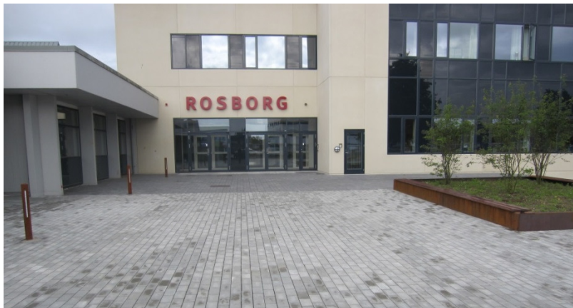
Hovedindgang Rosborg Gymnasium & HF.

På tidspunktet for besøget var Rosborg Gymnasium i færd med at anlægge arealet foran hovedindgangen. Arealet foran hovedindgangen var belagt med fliser. Fliserne var i en lys grå farve, og der var ingen kontraster eller ledelinjer til at guide blinde og svagsynede til indgangen. I venstre side af pladsen var opsat lys i form af lave rustfarvede lyspæle. På modsatte side var anlagt et forhøjet bed med grøn beplantning. Der var etableret en bænk på den ene side af bedet. Det forhøjede bed var udført i samme rustfarvede materiale som lyspælene.