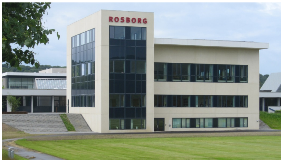
Rosborg Gymnasium & HF.

Rosborg Gymnasium blev efter det oplyste bygget i perioden fra 1973-1975. I 2007 blev skolens eneste daværende handicapprojekt renoveret. Rosborg Gymnasium blev desuden gennemrenoveret og udbygget med en syd- og en nordfløj i perioden fra 2011 til 2014, og der blev i denne forbindelse etableret i alt 4 nye handicapprojekter. Der blev desuden etableret elevator i begge tilbygninger.